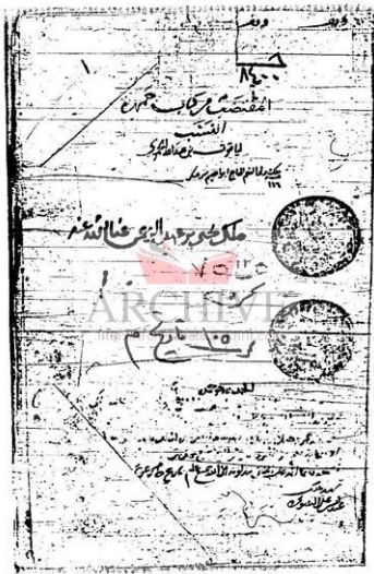
صورة الصفحة الأولى من الكتاب